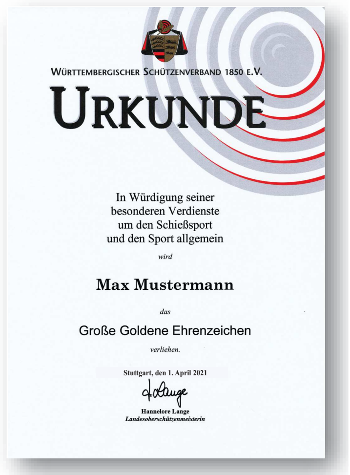
Abbildung in Originalgröße