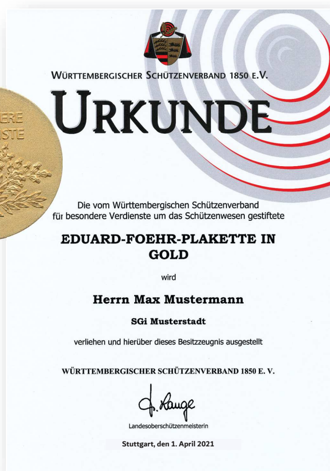
Abbildung in Originalgröße