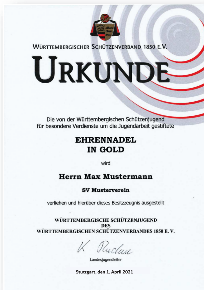
Abbildung in Originalgröße