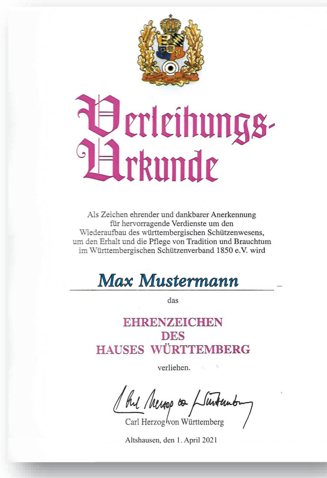
Abbildung in Originalgröße