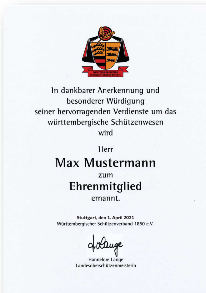
Abbildung in Originalgröße