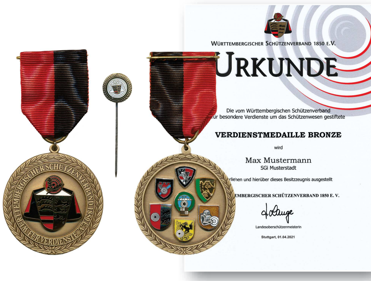
Abbildung in Originalgröße