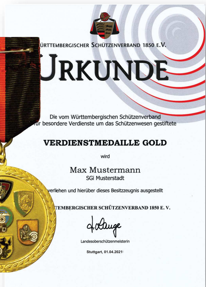
Abbildung in Originalgröße