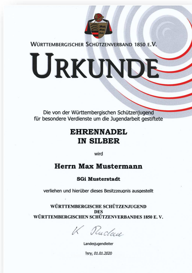
Abbildung in Originalgröße