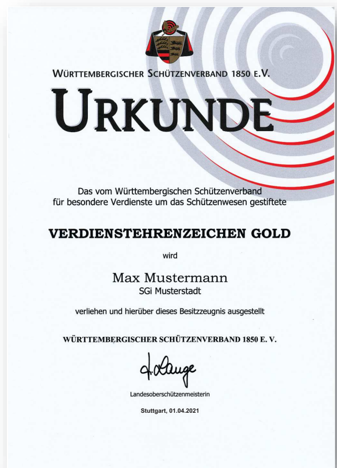
Abbildung in Originalgröße