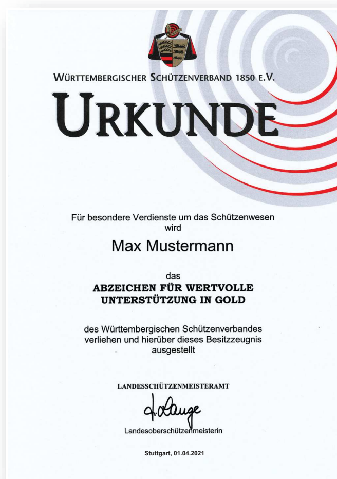
Abbildung in Originalgröße