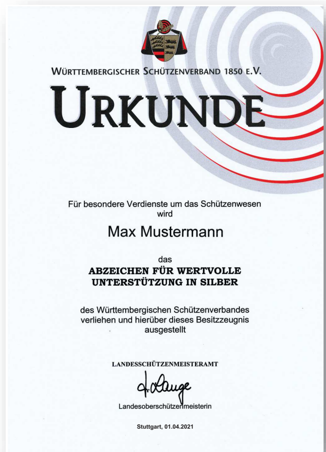
Abbildung in Originalgröße