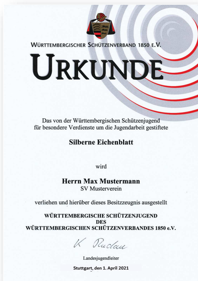
Abbildung in Originalgröße