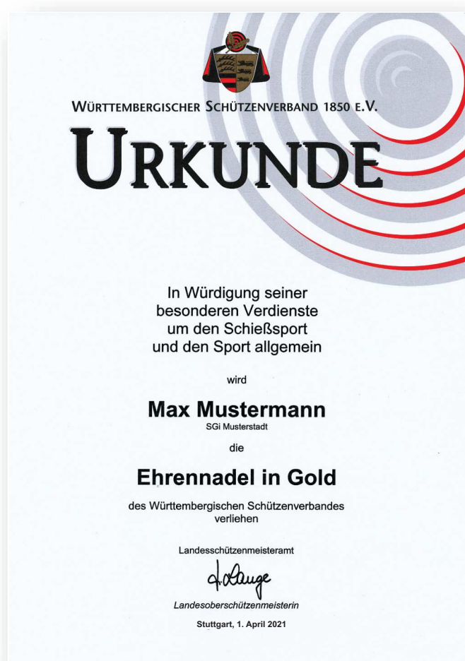
Abbildung in Originalgröße